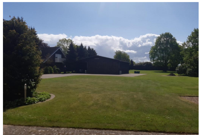
Außenaufnahme des Baulandes