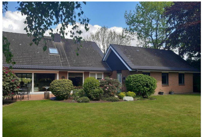
Rückansicht + Garagenrückansicht