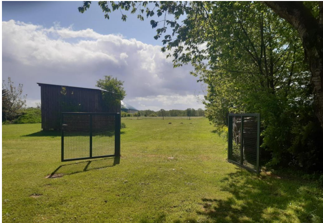
Weideland mit Pferdeunterstand