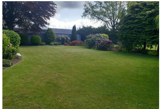
Garten des Wohnhauses