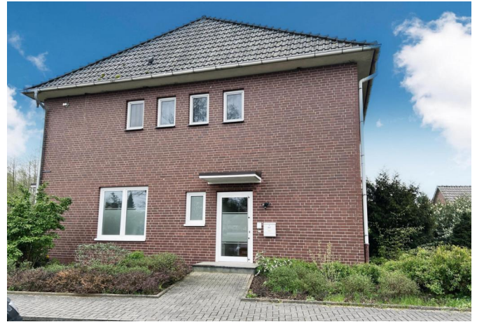
Eingang am Stellplatz