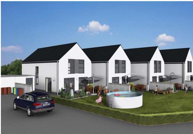
Gartenansicht - Visualisiert