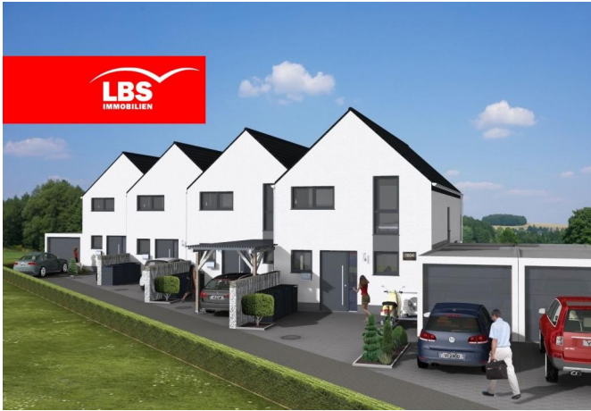
Hauseingänge - Visualisiert -