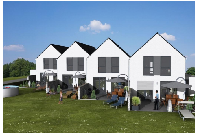
Gartenansicht - Visualisiert