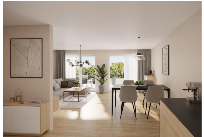
Wohnen - Visualisierung