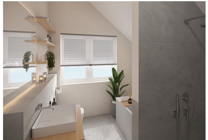
Bad - Visualisierung