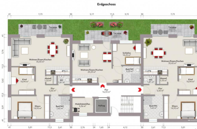
Erdgeschoss Wohneinheit 3 / 2 / 1