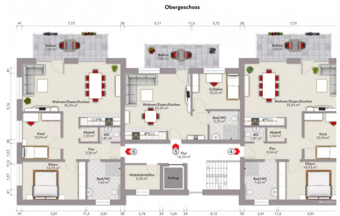
1. Etage, Wohneinheiten 6 / 5 / 4