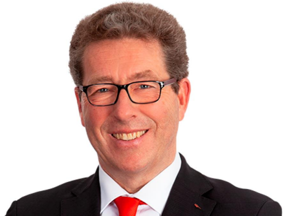
Ansprechpartner: T. Pils