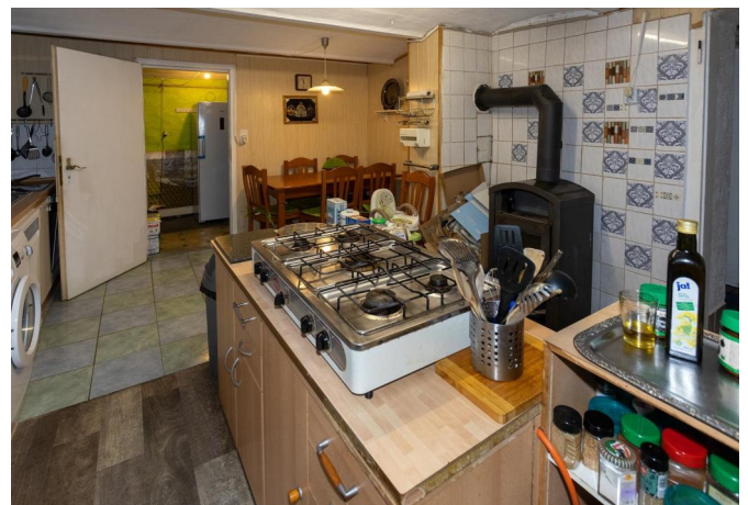
Keller: Küche mit Kaminofen