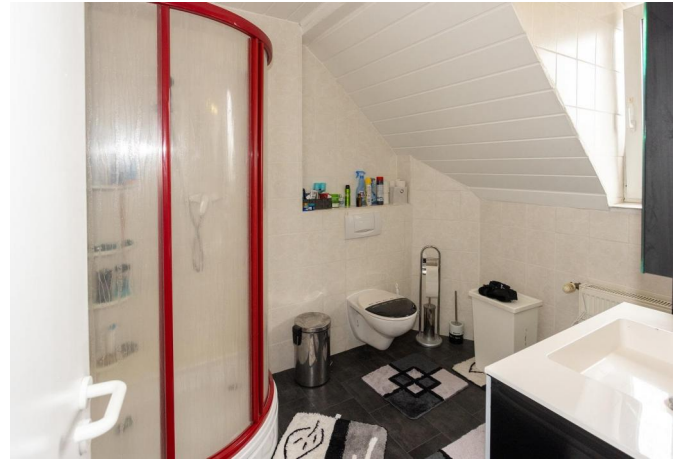
DG: Tageslichtbad mit Dusche