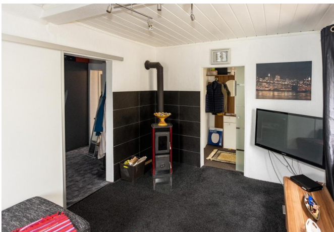
DG: Wohnen mit Kaminofen