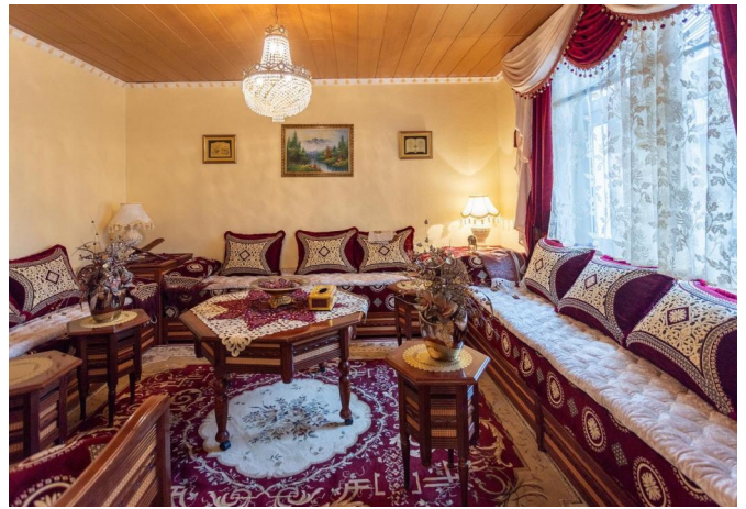
EG: Wohnen 2