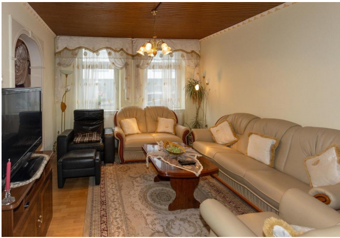
EG: Wohnen 1