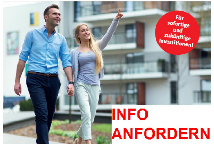
Investoren + Bausparen