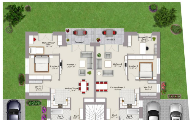
Erdgeschoß links Wohnung 1