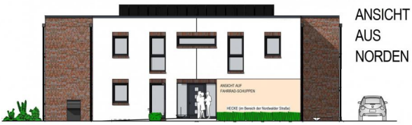
ANSICHT AUS NORDEN