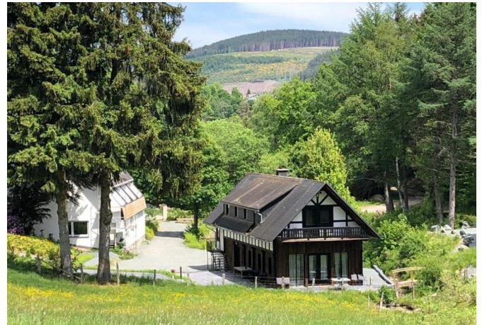
Haus 2 und 3