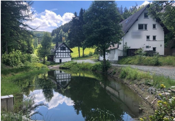
Frontansicht Haus 2 und 3