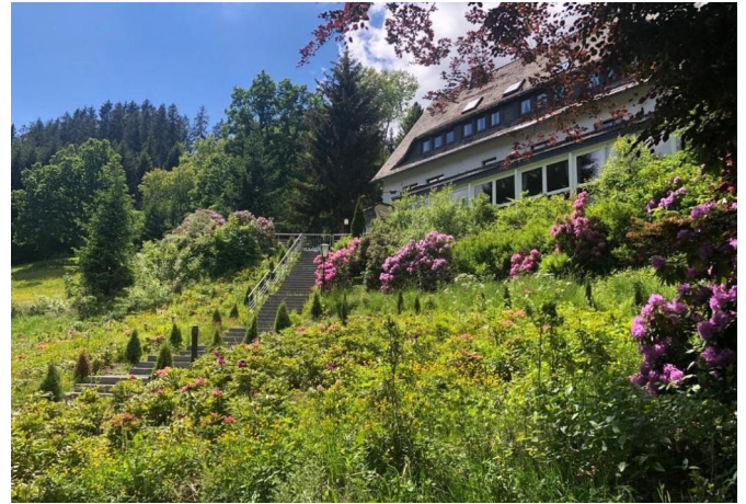
Blick von Süden