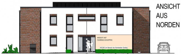
ANSICHT AUS NORDEN