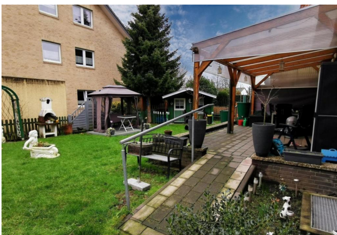
Garten & Terrasse