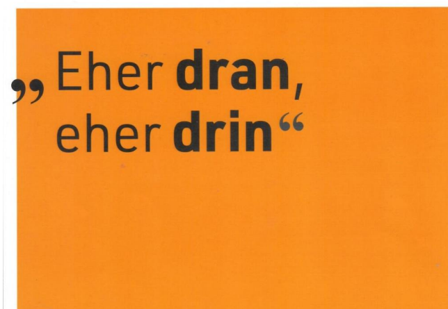
Immobilie1 eher dran