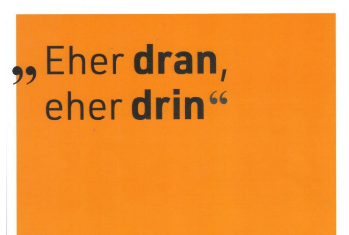
Immobilie1 eher dran