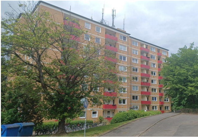
Ansicht der Wohnanlage