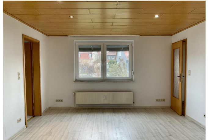
Wohnzimmer im EG