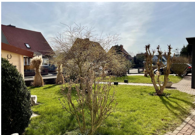
Außenbereich vor dem Haus