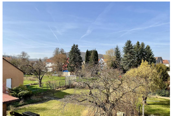
Blick vom Balkon