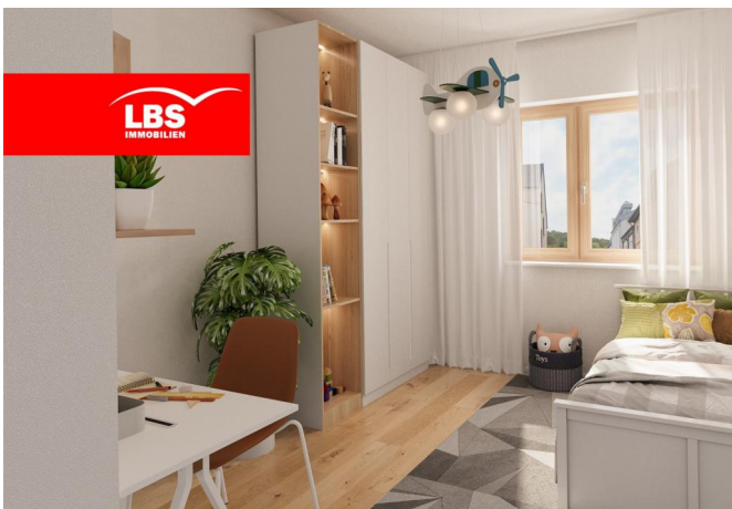
Musterwohnung WE 19