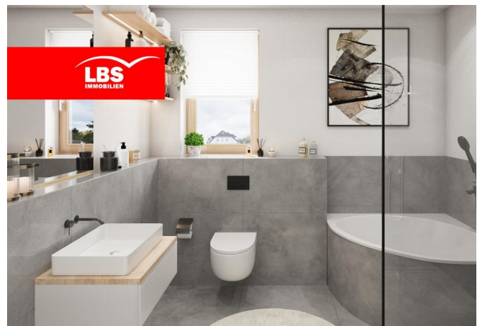
Musterwohnung WE 19