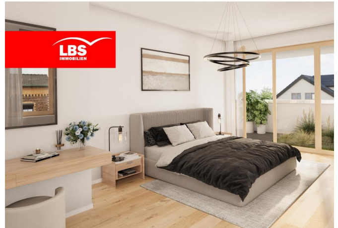
Musterwohnung WE 19