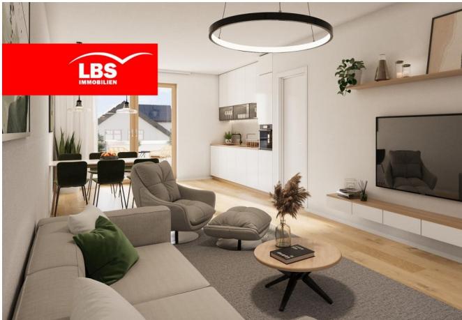
Musterwohnung WE 19