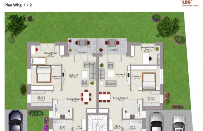
Erdgeschoß links Wohnung 1