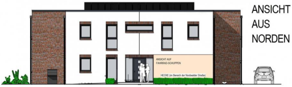
ANSICHT AUS NORDEN