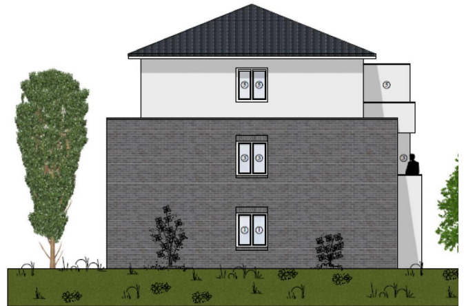
Ansicht seitlich 2