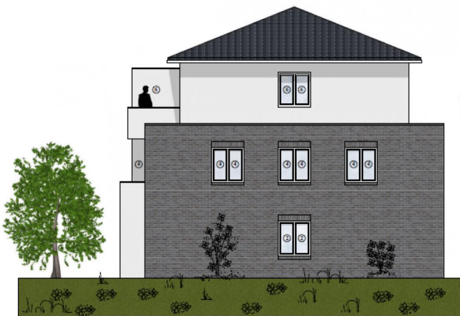
Ansicht seitlich 1