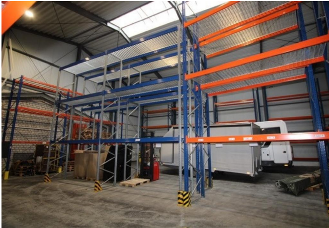
10m hohe Lagerhalle