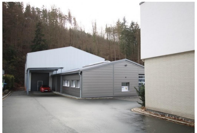
Lagerhalle & Versand