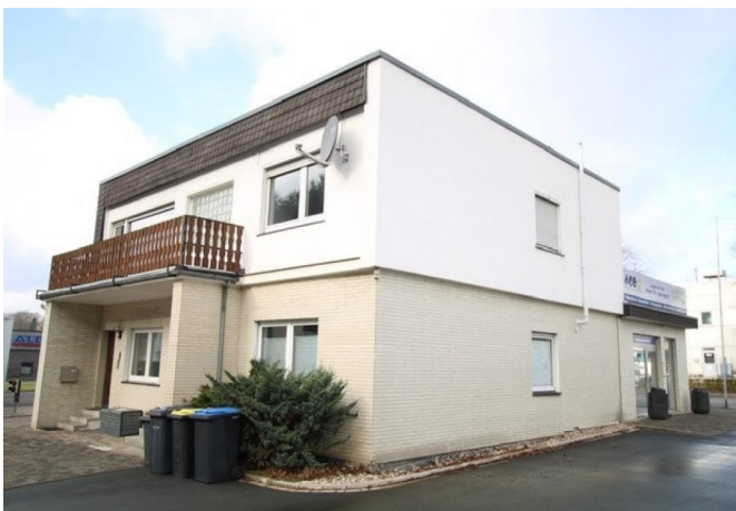
Büro mit verm. Wohnung