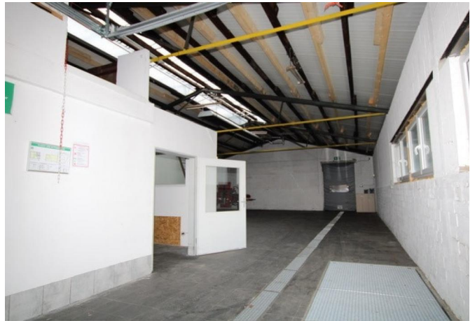
Lager & Versand