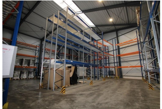
10m hohe Lagerhalle