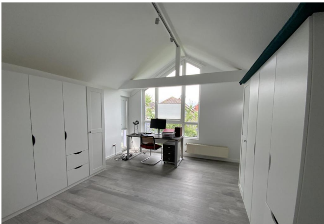
Schlafzimmer II OG