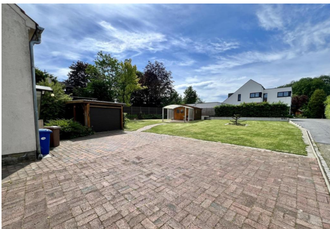
Carport und Gartenhaus