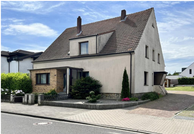
Eingang EG und seitlich OG