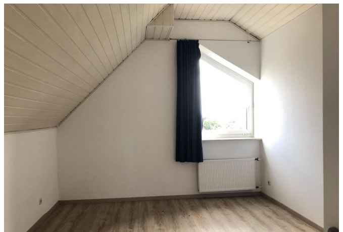
Schlafzimmer 1 DG