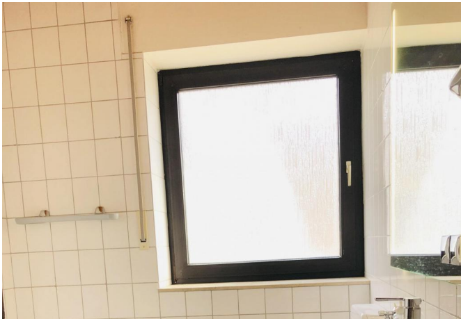
Bad 1. OG