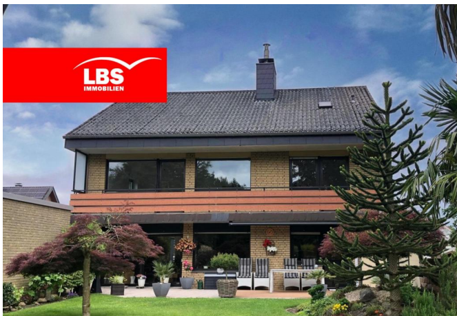
Ansicht Gartenseite 3