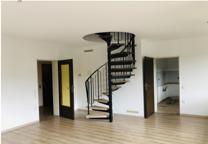
Wohnzimmer mit Wendeltreppe