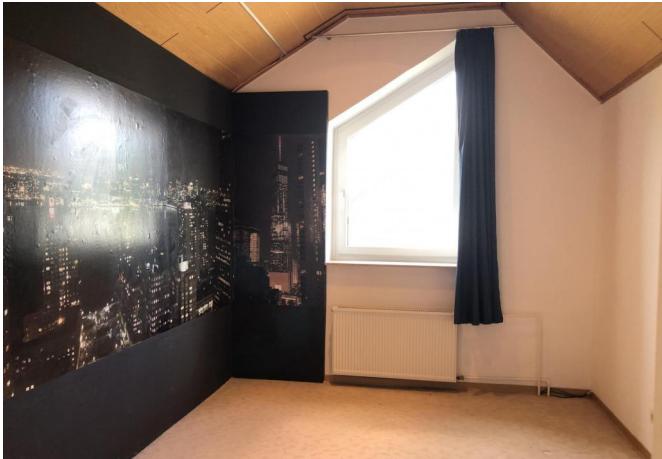
Schlafzimmer 2 DG mit Ankleide