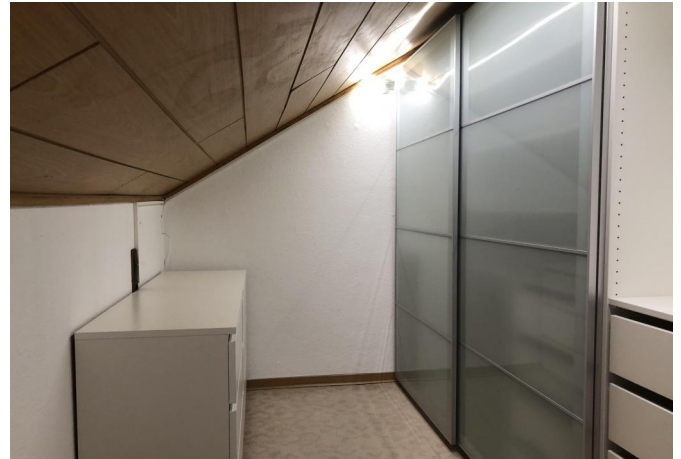
Ankleide SZ DG