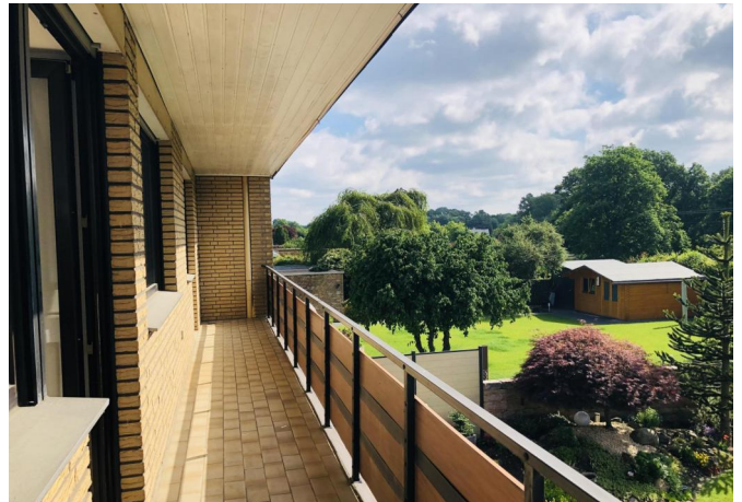
Balkon mit Blick ins Grüne